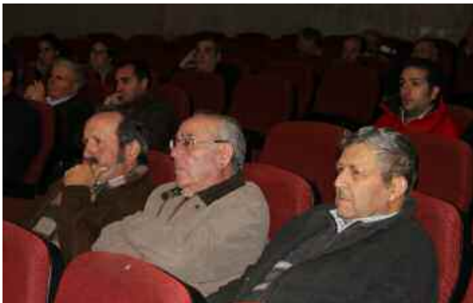
Durante la Asamblea se abordaron los temas de interés del sector agrario regional.