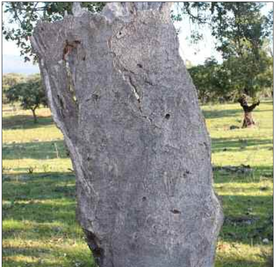
Estado de numerosas encinas y alcornoques en la zona de la Sierra de San Pedro (Alburquerque), donde el problema se ha extendido.