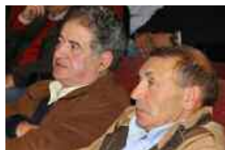
Dos socios siguen la asamblea.