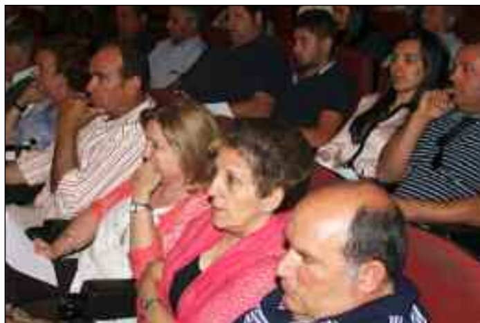
Imágenes de la asamblea de socios para la elección de presidente que tuvo lugar en Zafra.