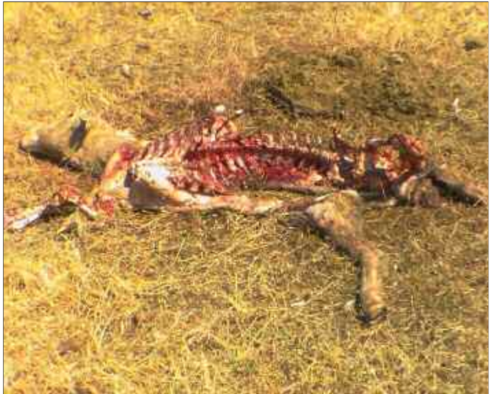
Estado en que quedó una de las ovejas atacadas.

En concreto, el veterinario resalta que "los cadáveres de dichos animales evidenciaban picotazos y desgarros de distintas partes de su anatomía, dando como resultado la muerte (cuatro de los cinco ejemplares muertos estaban prácticamente en el esqueleto)" , describe. Además, "en la exploración externa de las 75 ovejas restantes existentes en la finca, ocho presentaban heridas graves (en los intestinos, hernias abdominales, desgarros cutáneos, etc.) y otras ocho ovejas tenían heridas más leves en distintas partes de su anatomía" , señala el veterinario,